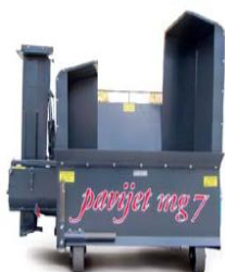
машина закрыта и готова к транспортировке