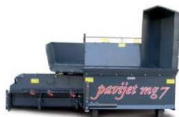
машина в полукрытом состоянии