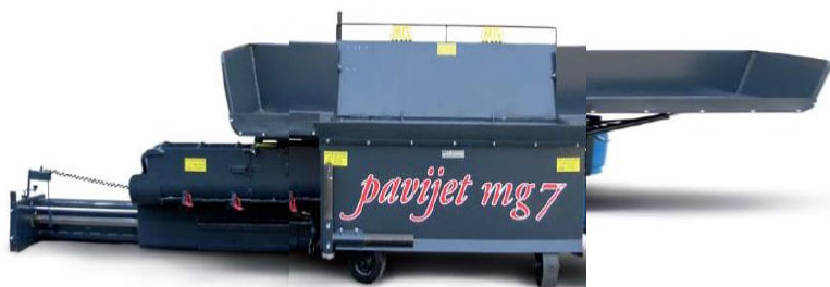
машина полностью открыта и готова к работе